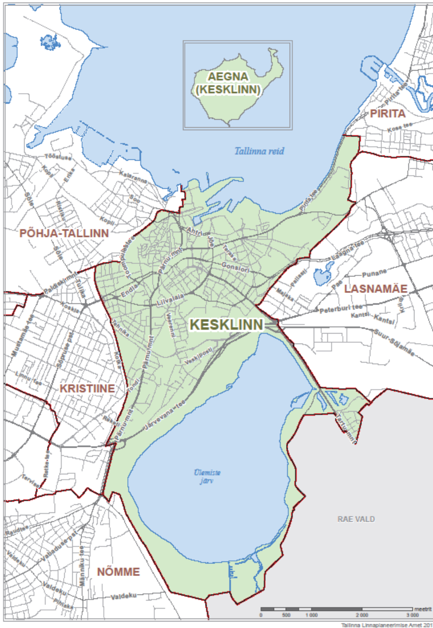
Kesklinna linnaosa skeem